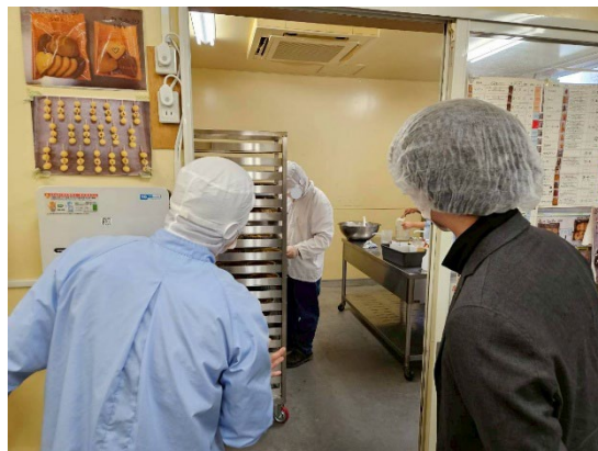
※くれよん工房見学の様子