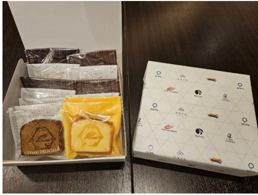
※グループ各社のロゴ入りパウンドケーキと包装紙